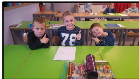
'groot helpt klein'

mirjam.hoogendoorn@degroeiling.nl anne-loes.oostendorp@degroeiling.nl monique.moons@degroeiling.nl